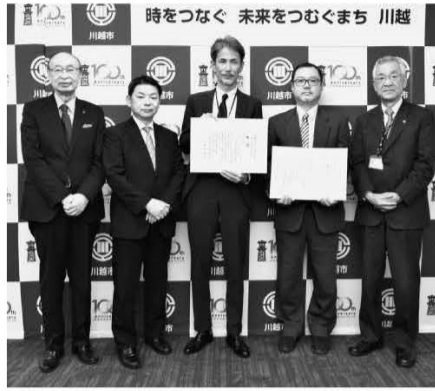
2021年度はヒーハイスが大賞に、的場電機製作所が奨励賞に輝いた