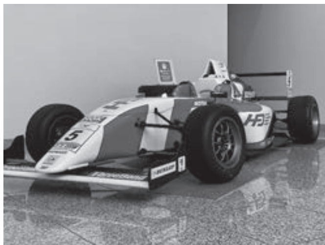
F4 レース車両を当社の1階ロビーに展示しております。