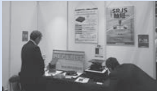
4月のOPIE'25展示会でも多くのお客様に関心を持っていただきました。